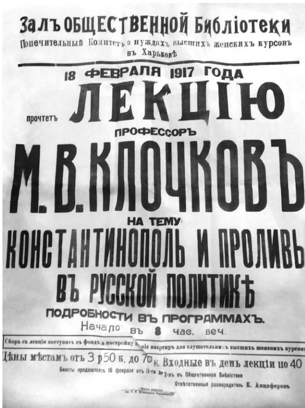
Архівний документ. Афіша лекції М. В. Ключкова «Константинополь і протоки в російській політиці»

(у юридичному корпусі університету) «Великий Новгород. Його соціальний побут та народо-владдя» [20, арк. 2]. Зазначена лекція була організована Харківським міським народним університетом.