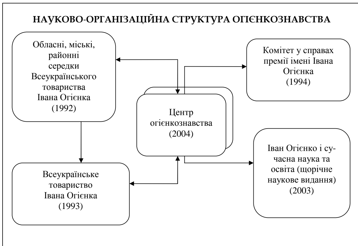
Схема № 1

Сьогодні є всі підстави стверджувати, що огієнкознавство відомо сформовано, має свої специфічні атрибути і складові частини, які становлять його дослідну архітектуру, дисциплінарну та організаційну структуру (Див.: схема № 1).